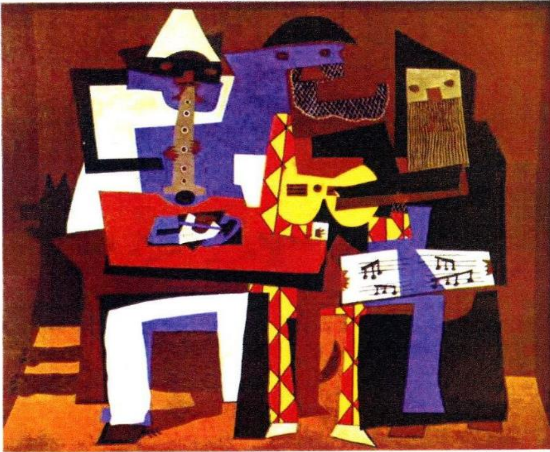
Pablo Picasso, Les trois musiciens aux masques , 1921, Huile sur toile, 200x247cm.